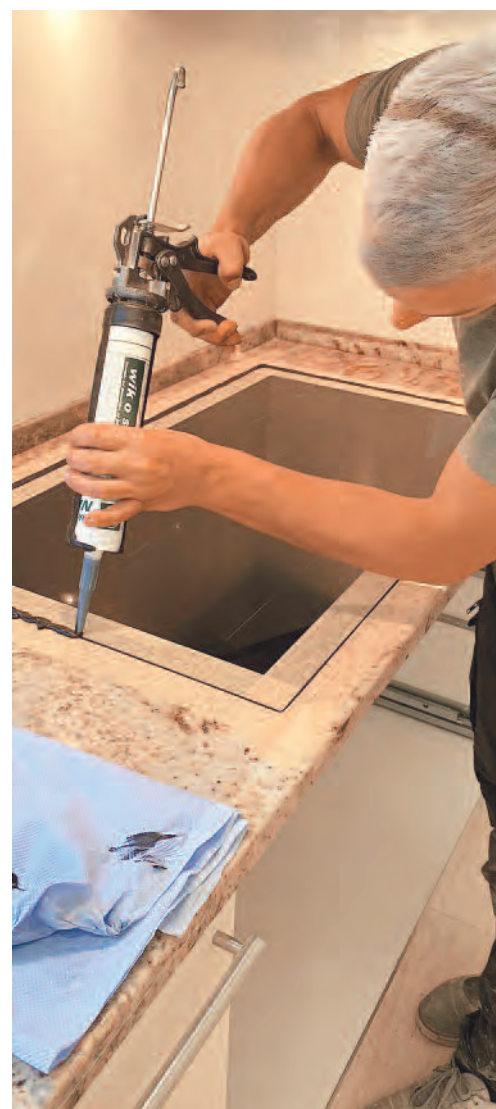
Le goût du travail soigné

“Au début, il faut faire sa place et s'intégrer dans le paysage professionnel de la région”, sourit-il. Et si les grands chantiers ne lui font pas peur, c'est plutôt dans des réalisations plus