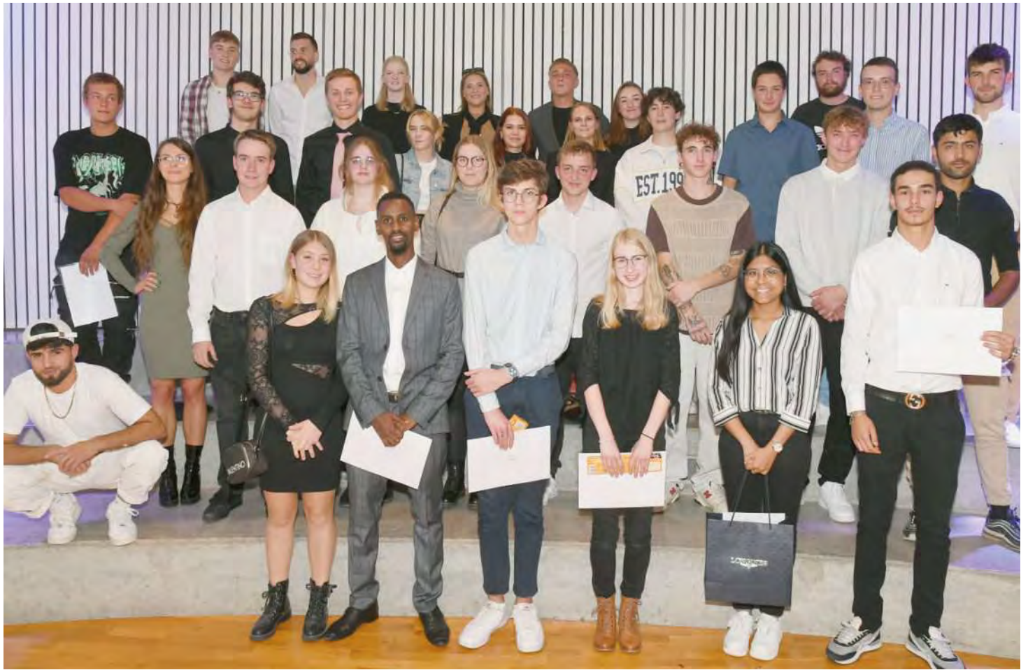
Les meilleurs apprentis et apprenties du Jura bernois et de Bienne: autant d'exemples de la qualité des formations duales.