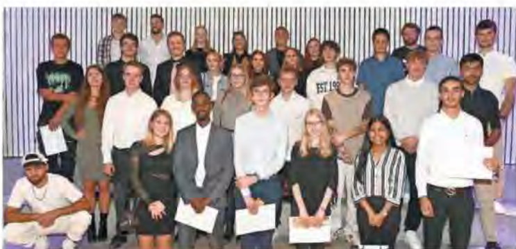
La crème des apprentis de la région a été célébrée à l'occasion d'une soirée de gala.