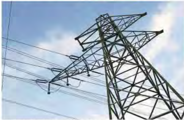
Les entreprises s'inquiètent en particulier d'un éventuel contingentement, qui les forcerait à réduire leur production.

Ce ralentissement de la dynamique positive amorcée en 2021 et qui n'avait cessé de progresser jusqu'ici malgré un contexte déjà marqué par la force du franc, la perturbation des chaînes d'approvisionnement ou encore l'inflation, semble trouver son origine