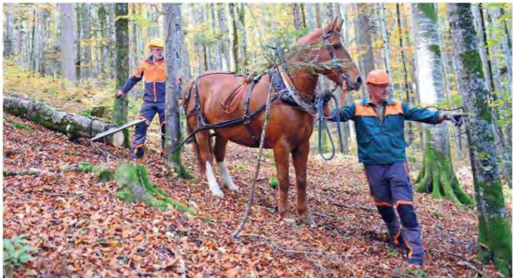
Avant de sortir les troncs d'arbres de la forêt, il faut judicieusement choisir le passage à emprunter avec le cheval.

Il y a quelque chose de doux et de triste à regarder ces chevaux et ces hommes œuvrer ensemble, juste au-dessus de Tramelan. À La Tanne, pour cet exercice de débardage à traction chevaline. Doux de se rappeler qu'on peut encore entendre le bois glisser sur les feuilles mortes sans aucun fracas mécanique, accompagné seulement du souffle de l'effort. Du bipède et du quadru-