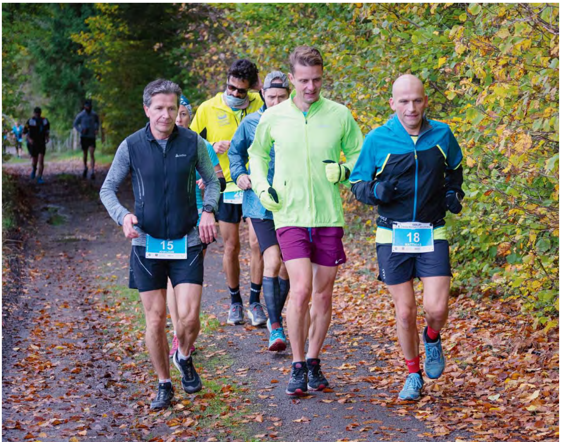
Au total, 33 coureuses et coureurs téméraires ont arpenté les 6,7 km de la boucle proposée jusqu'à l'épuisement. Le meilleur a mis la flèche après 28 heures d'effort.

Premier événement du genre pour l'Association Moutier Trail et premier Swiss Backyard Ultra en Suisse romande, cette course inédite doit s'organiser dans des conditions très précises. «C'est un concept complètement fou venu tout droit d'outre-Atlan-