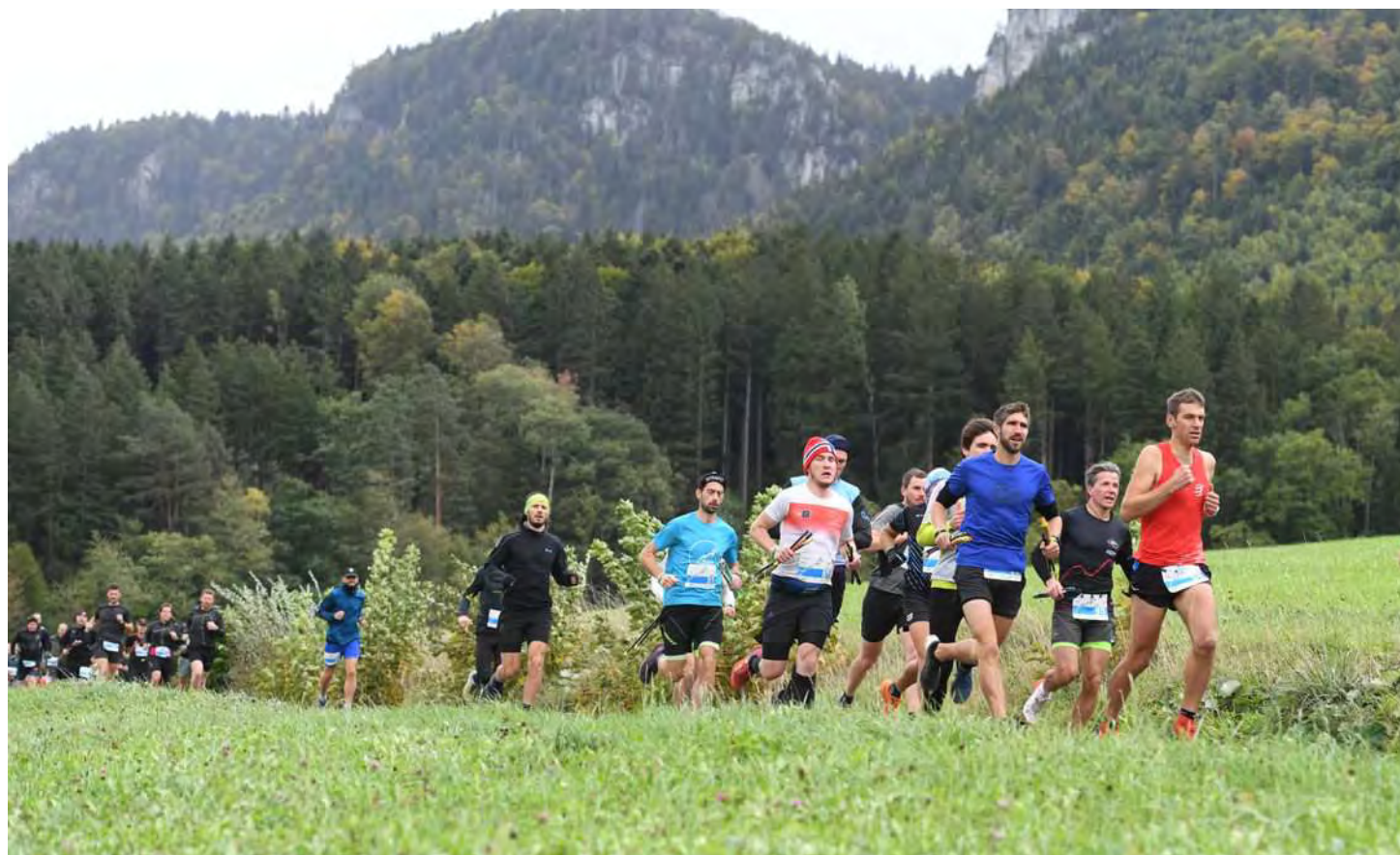
Les participants à la course Moutier-Graiterie ont dû affronter des conditions météo difficiles samedi matin.