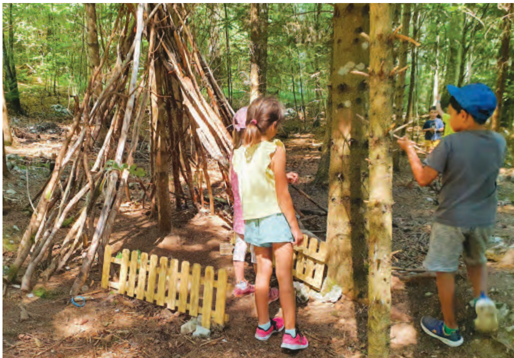
L'EJC met un point d'honneur à pratiquer un maximum d'activités en plein air

Sortant des sentiers battus, créative et originale, la soirée d'information de l'EJC a permis aux parents de découvrir la structure sous un jour nouveau. De poste en poste (six au total) les cinq groupes formés par la quarantaine de parents ayant répondu à l'invitation ont suivi le jeu de piste proposé par les responsables, une manière différente de se présenter tout en mêlant questions pratiques et activités participatives.