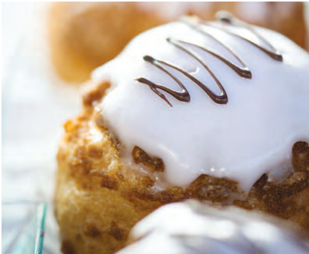
Le pâtissier Roland Morel initiera les participants à la pâte à choux

Toujours prêt à proposer des activités aussi originales qu'attractives, le Groupe d'Animation de Diesse (GAD) a concocté un automne gourmand, avec, à la clé, un atelier de pâtisserie. Un après-midi consacré à la pâte à choux, où les participants apprendront à réaliser deux mignardises qu'ils pourront ensuite refaire chez eux. Une délicieuse activité !