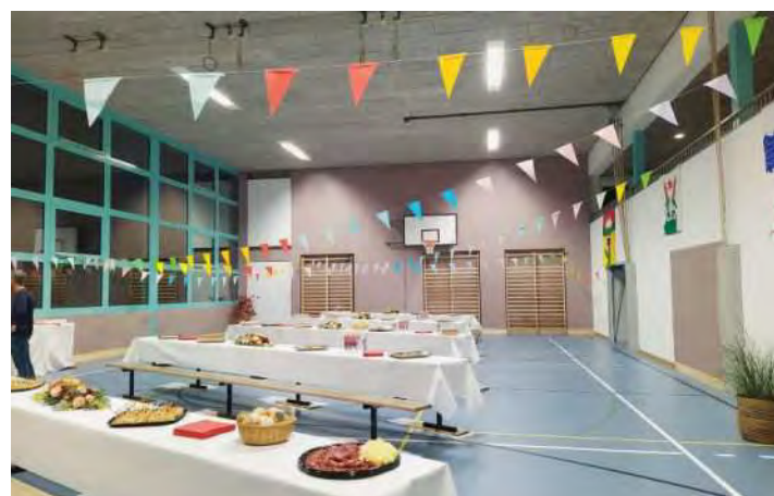
Petits fours de circonstance pour l'inauguration de la halle, jeudi soir.