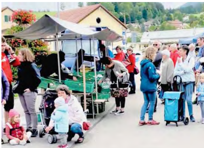
Le deuxième marché artisanal se tiendra samedi sur la place de la gare de Tavannes.

Si le marché aux légumes se tiendra chaque samedi jusqu'à la fin du mois, la conseillère municipale tire un bilan plus que positif de cette première année de marché. «La version artisanale attire du monde.