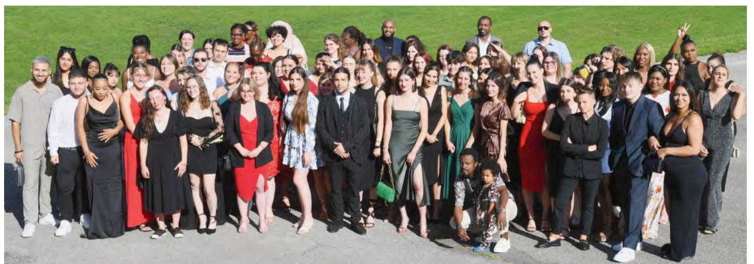
Des étudiants souriants et heureux lors de la traditionnelle photo de famille.

Dual: Affolter Thaïs, Moutier; Agrebi Dubois Malik, Bienne; Azoh Rachel,