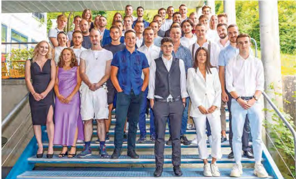
Diplômés en poche, ils peuvent partir en vacances le cœur léger!