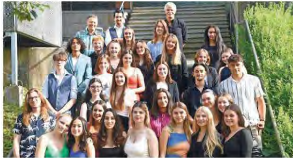
Sourire de mise pour les trois classes de culture générale de l'EMSp.