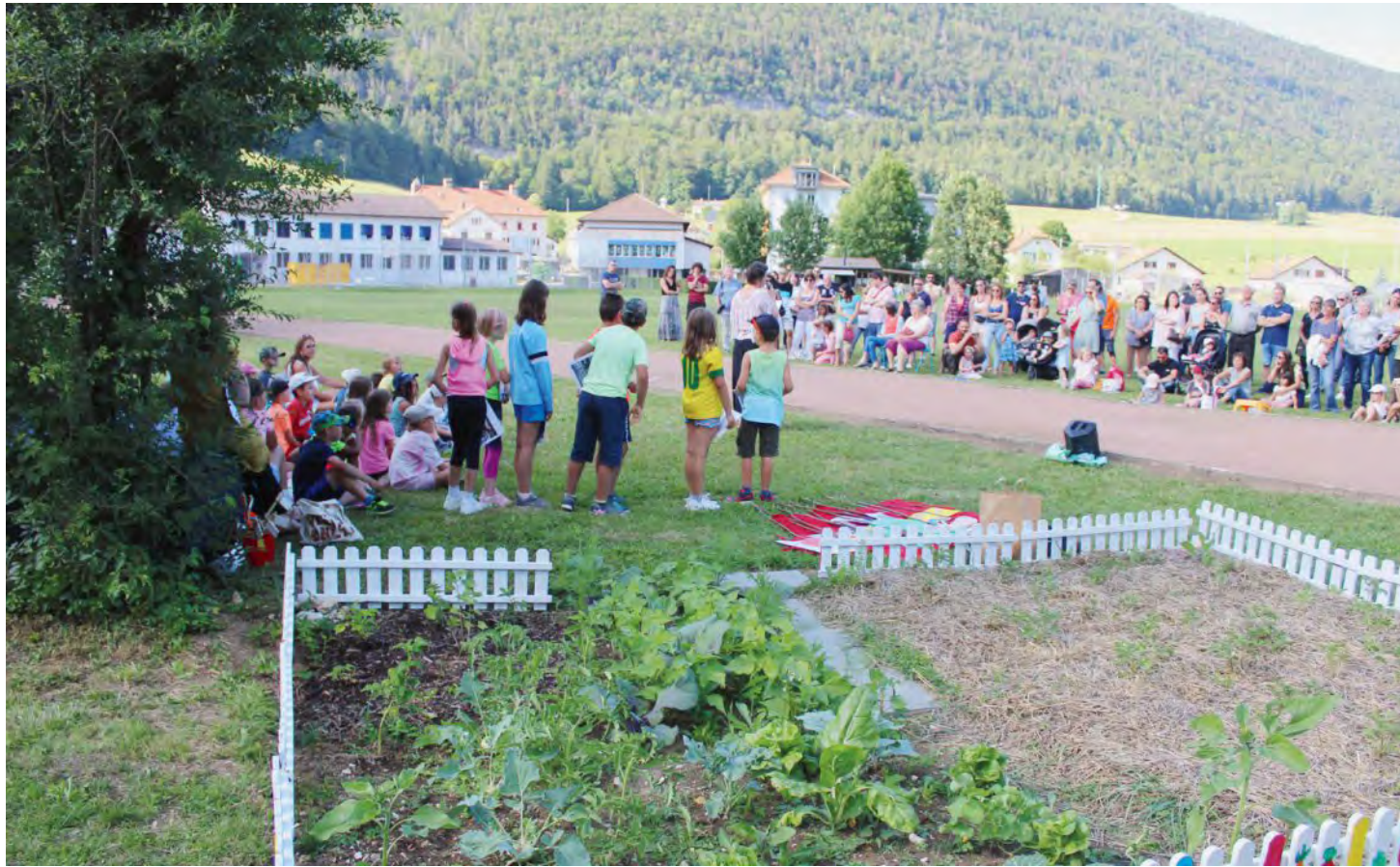
Le public est venu nombreux pour fêter l'avènement du jardin potager pédagogique à Cortébert. ULRICH KNUCHEL

En fin d'après-midi du 6 juillet, les élèves du village procédaient à une ultime répétition de leurs productions, au bord de la rivière. Car, en même temps que la fin de l'année scolaire, on allait fêter l'avènement du jardin potager pédagogique. Naturellement, ce dernier n'est pas tombé du ciel, par un coup de baguette magique: il a fallu le créer de toutes pièces. Pour d'évidentes raisons stratégiques, l'endroit a été choisi proche de la Suze, mais également proche de l'école.