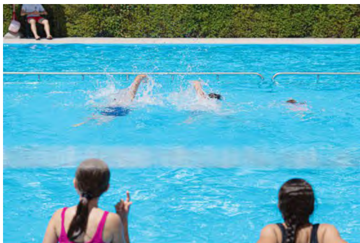
Les 23 élèves effectuent un relais par équipes de deux dans l'eau, puis ils se dirigent devant la patinoire imérienne pour la partie vélo.