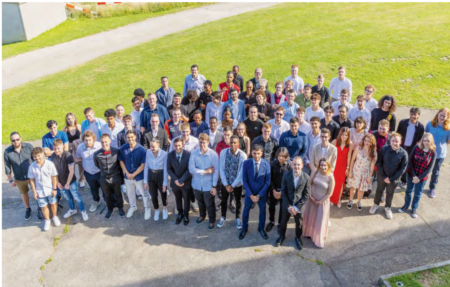
Les lauréats du ceff Industrie ont reçu leur précieux sésame mercredi.

Allemand Jérémie, Evillard. Assunção Gaëtan, Les Breuleux. Besia Flavien, Cressier. Blanc