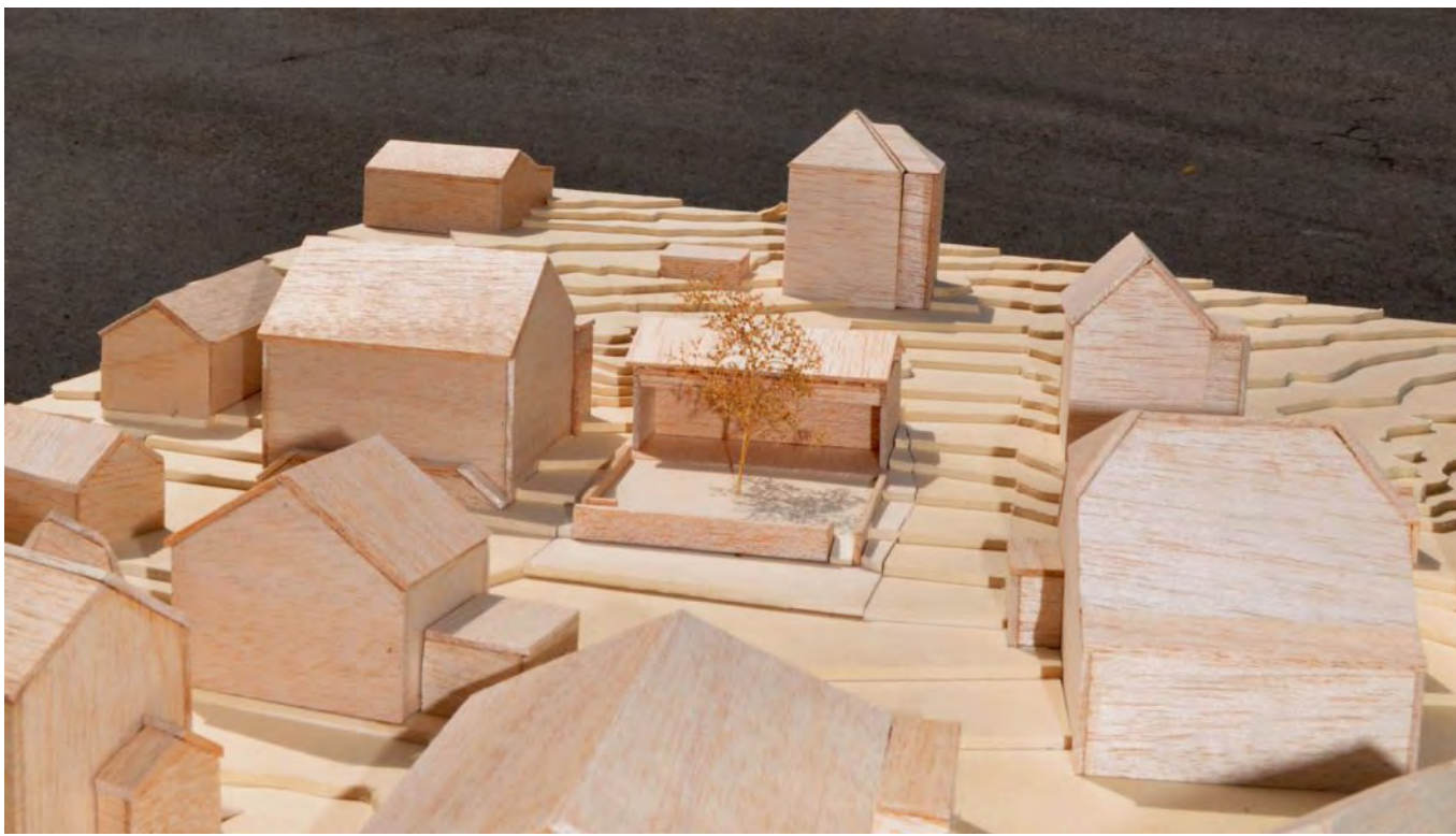
Un aperçu de la maquette de l'avant-projet du bâtiment multifonctionnel proposé par l'Exécutif.

Un bâtiment multifonctionnel contenant un commerce local, une agence postale et un espace pour la collecte des déchets sur la place des Ruaux de Cortébert, c'est peut-être ce dont les villageois pourront disposer à l'avenir. C'est en tout cas une piste de réflexion qu'a entamé le Conseil municipal. Il a présenté cet avant-projet le 20 juin lors de l'assemblée municipale. Ce nouveau projet pourrait remplacer l'échoppe «Chez Jean-Pierre», actuellement en activité. Mais pour l'instant rien n'est encore certain comme l'explique le maire de Cortébert, Manfred Bühler. «Pour le moment, nous sommes dans l'incertitude tant du côté du magasin, que sur cette ébauche, ce qui est compréhensible dans la situation actuelle. Nous avons juste discuté et lancé quelques idées pour l'avenir.»