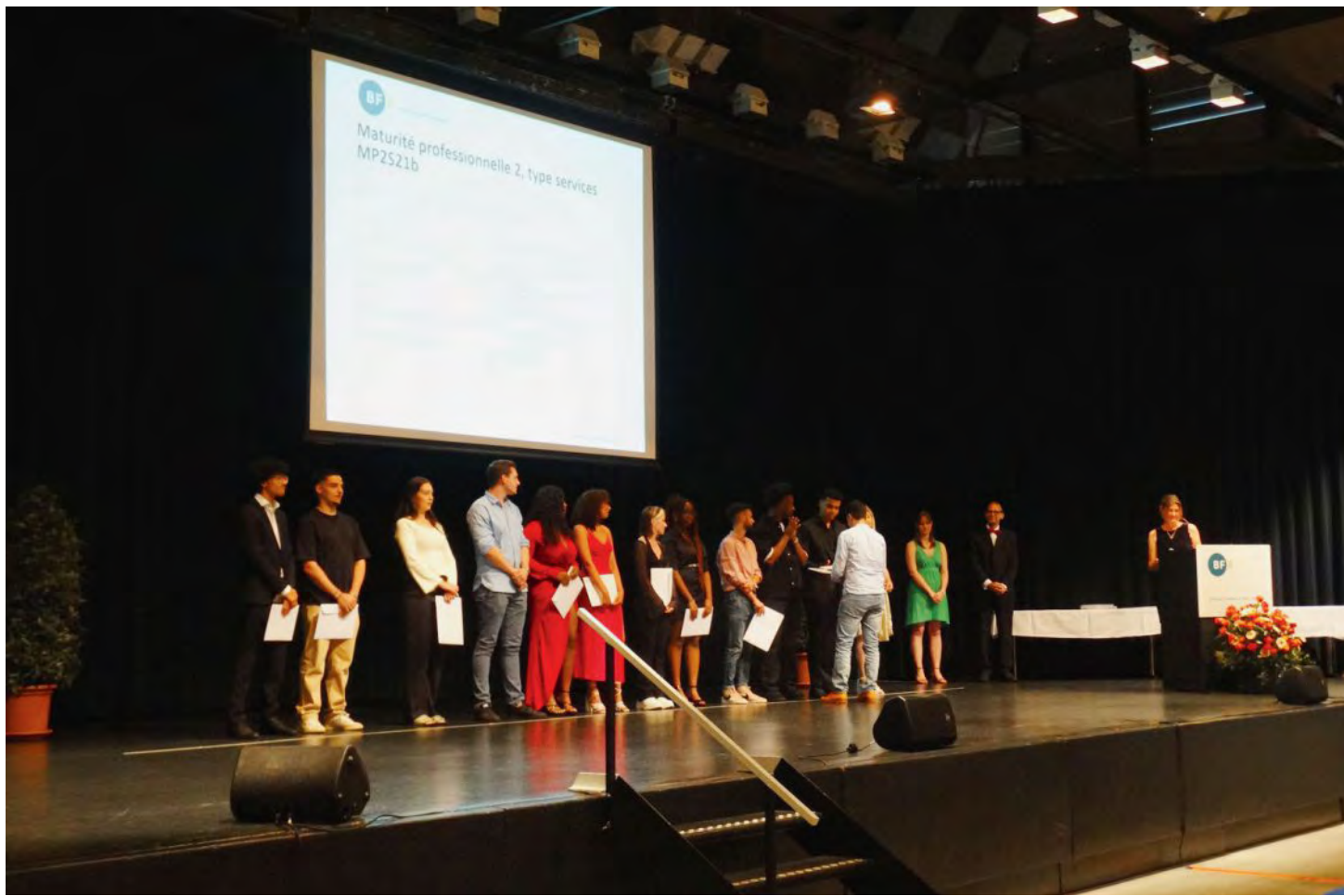
La cérémonie des diplômes de la BFB a été organisée mercredi au Palais des Congrès, à Bienne.