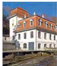
L'usine de pâte à papier de Rondchâtel.

du film La Roue d'Abel Gance et à 20 h 30 l'épisode IV. Enfin, le 27 août, l'amateur de culture terminera son copieux mois par une visite de la cimenterie Vigier le matin et la découverte de la voie lente qui doit résoudre les problèmes des cyclistes et des automobilistes par le partage du tronçon routier entre Frinville et Péry. L'après-midi, dans l'ancienne usine de pâte de bois, se tiendront trois concerts (11 h, 13 h, 14 h 30) qui reprendront l'intégral des sonates pour piano de Prokofiev. AME