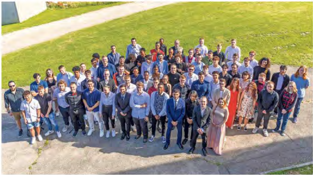
Les lauréats peuvent aborder les vacances le cœur léger.