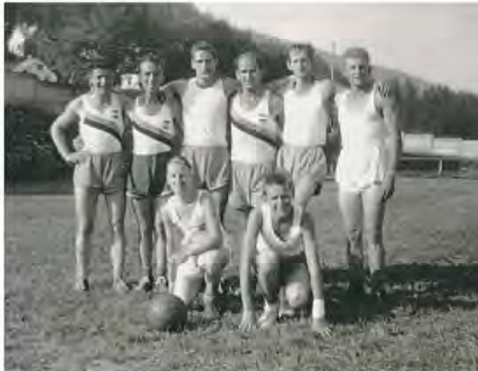
Des documents et photos d'archives jalonnent les haltes du parcours. MÉMOIRES D'ICI

Premier groupement de gymnastique à avoir vu le jour dans le Jura bernois, la FSG Saint-Imier est aujourd'hui une gaillarde vieille dame, entourée à ce jour de 130 membres adultes et 120 enfants. Avec l'appui de la Commune, de quelques bons sponsors et fournisseurs locaux, le comité directeur s'est doté de moyens idoines pour mettre en fête une telle famille. Populaires et très en vogue, les marches gourmandes étaient depuis un certain temps dans le viseur de la FSG Saint-Imier. Afin de permettre à un maximum de membres de partici-