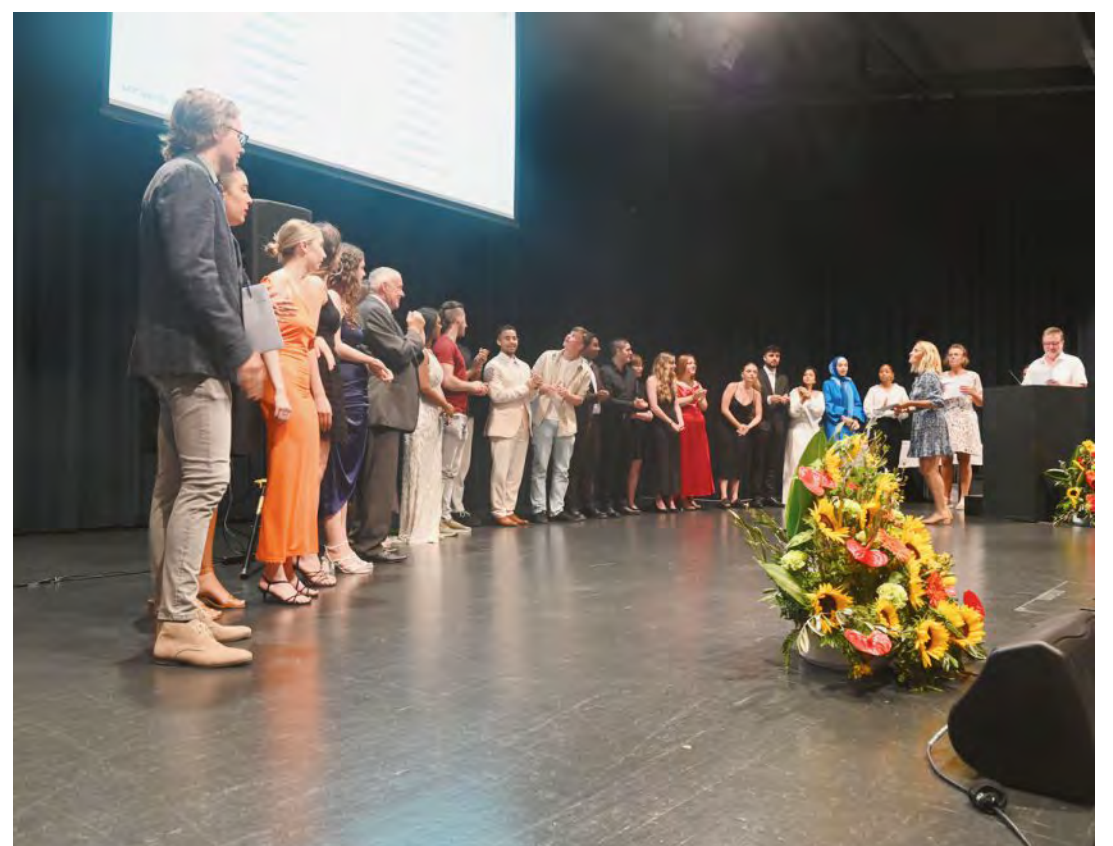
Moment solennel que celui de la remise de diplômes pour les lauréats de l'École supérieure de commerce de la Neuveville.