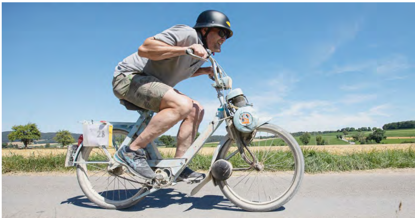
Durant six heures, 42 équipes se sont livrées à une âpre bataille pour remporter la course de Solex sur le plateau de Diesse.

PAR FRANCISCO RODRÍGUEZ TRADUCTION MARCEL GASSER