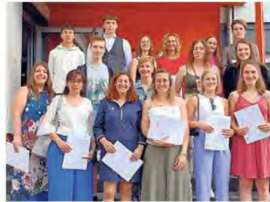
Que d'heureux diplômés à Moutier!