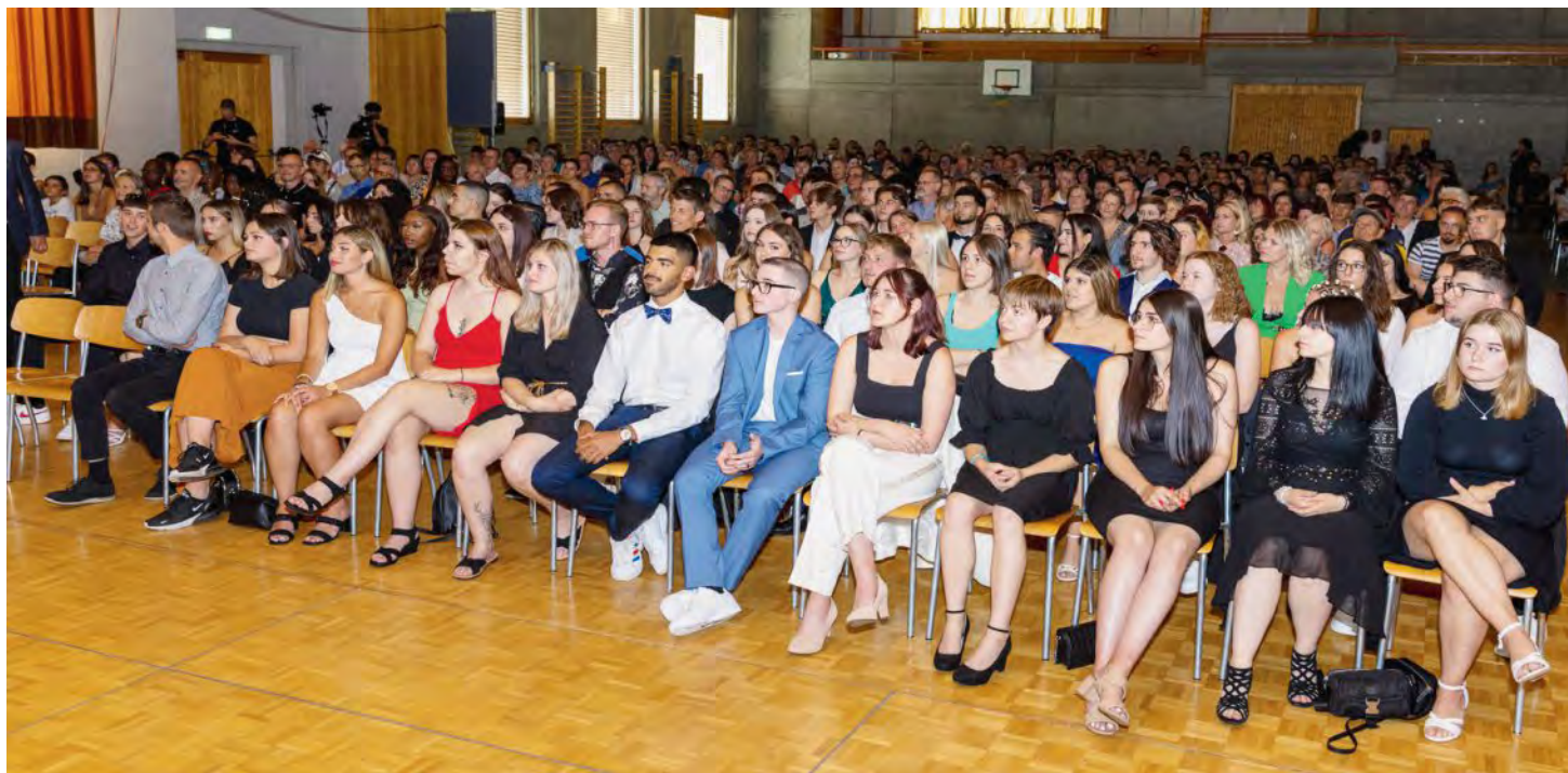
La cérémonie des diplômes du ceff Commerce a été organisée à la salle de la Marelle à Tramelan