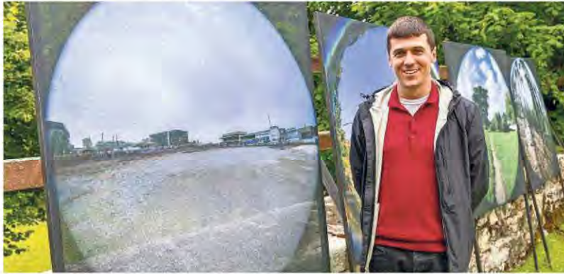
Emanuel Rossetti et ses photographies de paysages translucides.

Concrètement, cette dernière se divise en trois pôles. À l'intérieur de l'abbatiale tout d'abord, dans le chœur, les vi-