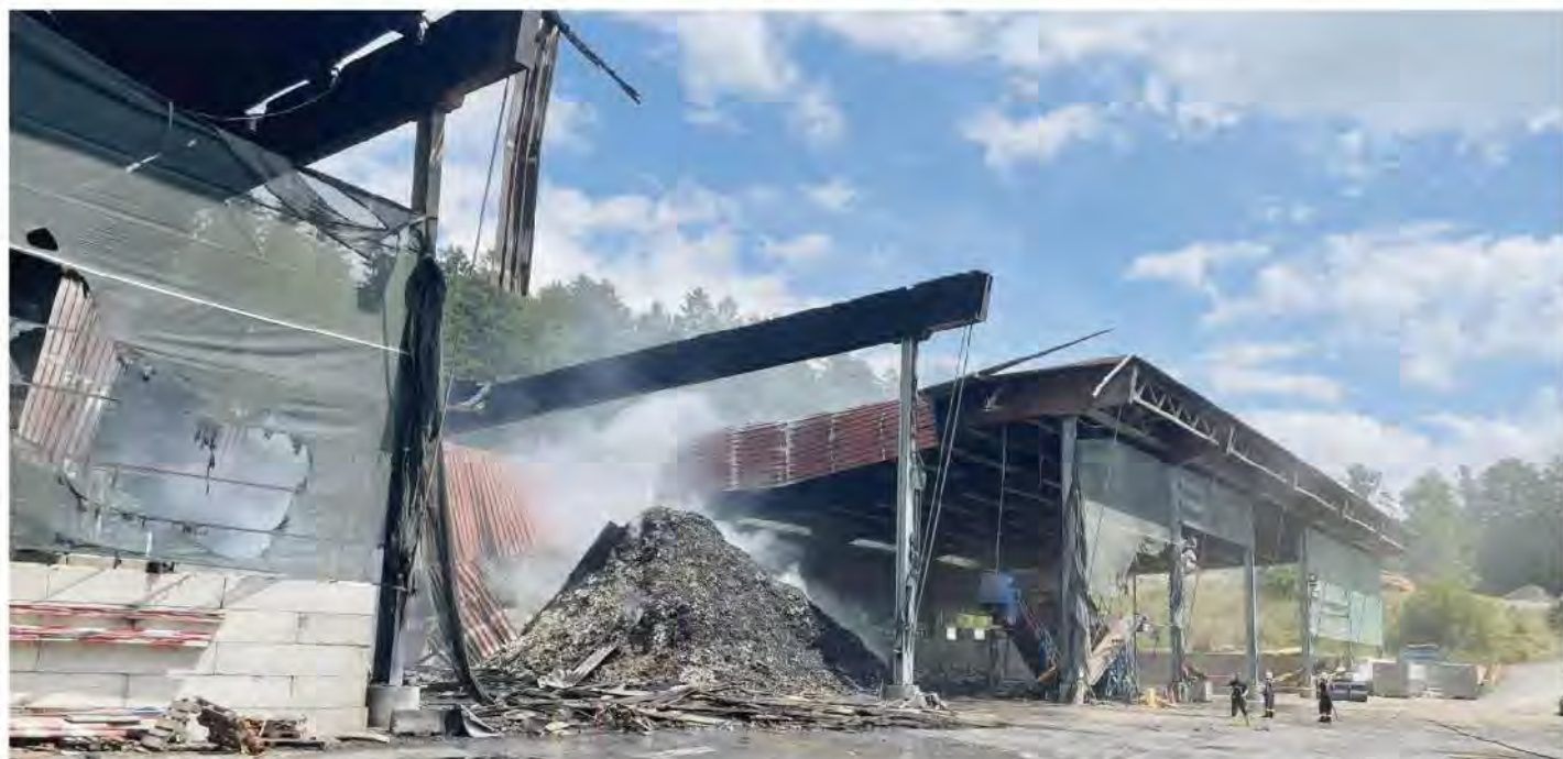
Il apparaît fort probable que la halle où étaient entreposés les déchets ménagers, encore fumants mercredi après-midi, devra être démolie et reconstruite entièrement.