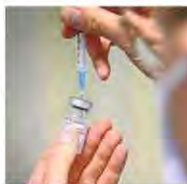
Le 2 e rappel pourra être administré aux plus de 80 ans.

CORONAVIRUS Le canton de Berne lance sa campagne pour le 2 e rappel de vaccin contre le Covid. Dans un communiqué publié hier, la Direction de la santé informe que les personnes de plus de 80 ans pourront se le faire administrer à partir du lundi 11 juillet. Elle rappelle que ce 2 e rappel peut être fait au plus tôt quatre mois après la précédente injection.