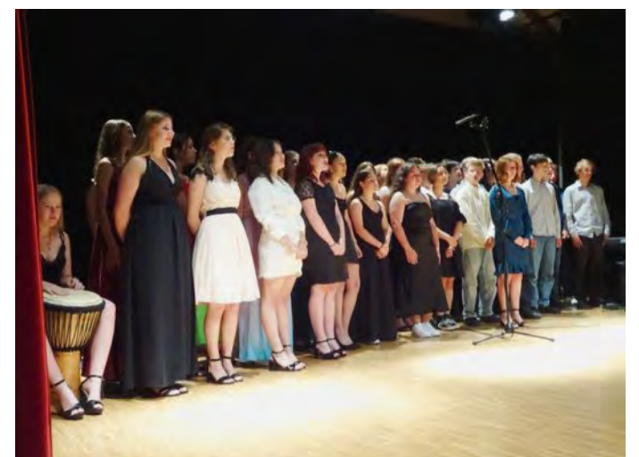
C'est plein d'émotion que les sortants ont entamé leur dernier chant. UK

Pour chaque classe, un power-point présentant chaque sortant de manière très originale a été projeté, soulevant parfois l'émotion des parents. Au sein de cette volée