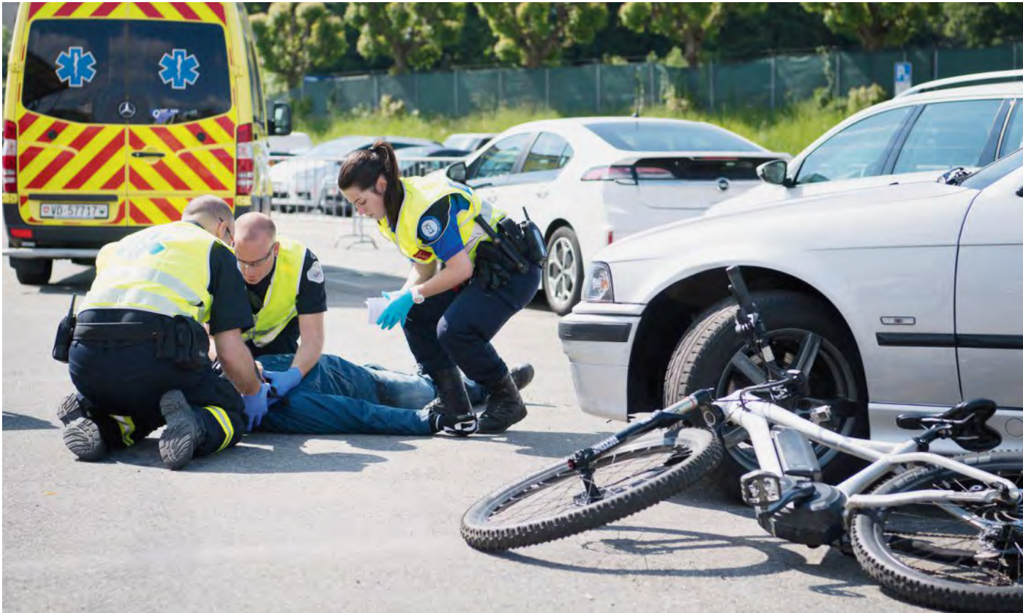
La vulnérabilité des cyclistes est largement augmentée avec les vélos électriques.

Le vélo électrique est en pleine expansion. Il s'en est vendu 358 000 en Suisse en 2020 et 2021. Corollaire, ou revers de la médaille, le nombre d'accidents impliquant leurs utilisateurs a pris la pente ascendante. L'an passé, 17 personnes ont perdu la vie et 531 ont été grièvement blessées, contre respectivement 15 et 521 en 2020. Le Bureau de prévention des accidents a ainsi tiré la sonnette d'alarme ce printemps. Il serait toutefois bien trop réducteur d'imputer cette augmentation à la seule hausse du nombre d'adeptes.