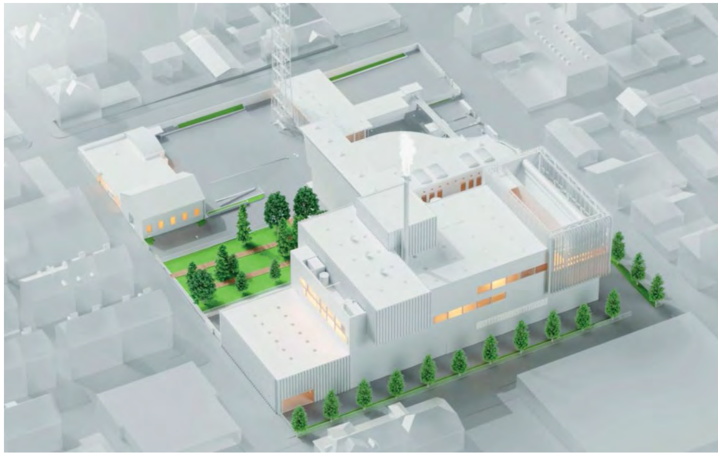
Cette image donne un aperçu des volumes de la future usine, prévue sur le site actuel de Vadec.

La Chaux-de-Fonds s'est rapidement imposée pour accueillir la nouvelle usine de valorisation thermique des déchets (UVTD). Dénommée Vadec évolution, «elle pose la ville dans le 21e siècle énergétique», se réjouit le président de commune, Patrick Herrmann.