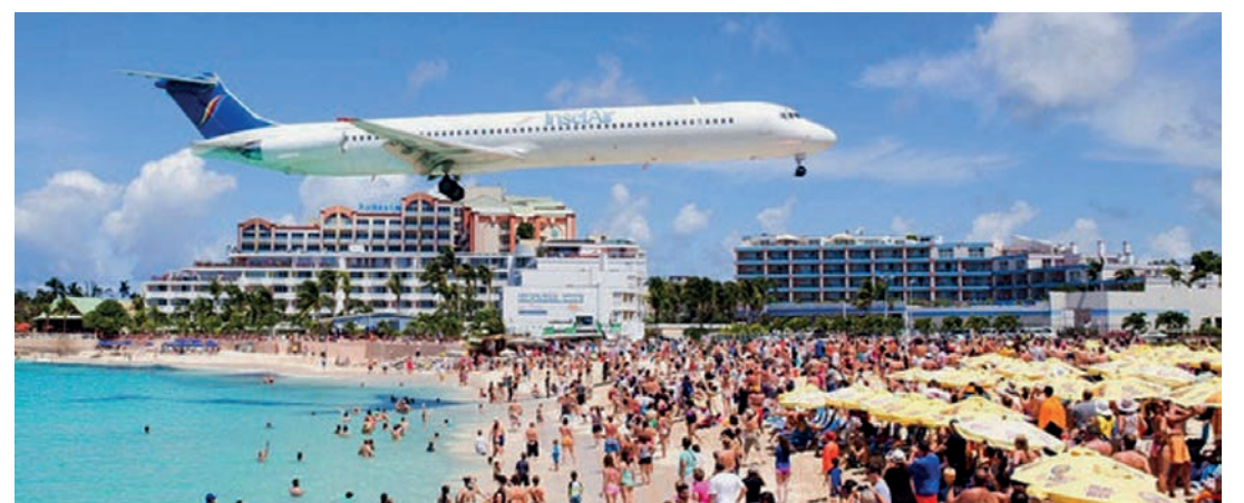
Il faut prévoir un budget plus important cette année pour s'envoler sur une plage lointaine

«Statistiquement, si les clients réservent très tard, les compagnies peuvent s'imaginer qu'il n'y aura pas les réservations suffisantes pour maintenir les vols». L'experte en voyages déconseille du coup les