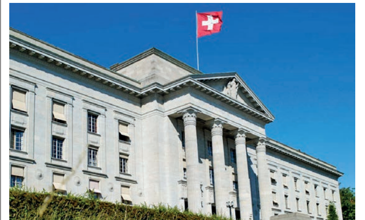
Dans un arrêt publié lundi, le Tribunal fédéral se rallie à l'argumentaire de la Cour suprême.

Justice Le Tribunal fédéral rejette le recours d'un homme condamné à 17 ans de prison pour tentative d'assassinat et viols répétés.