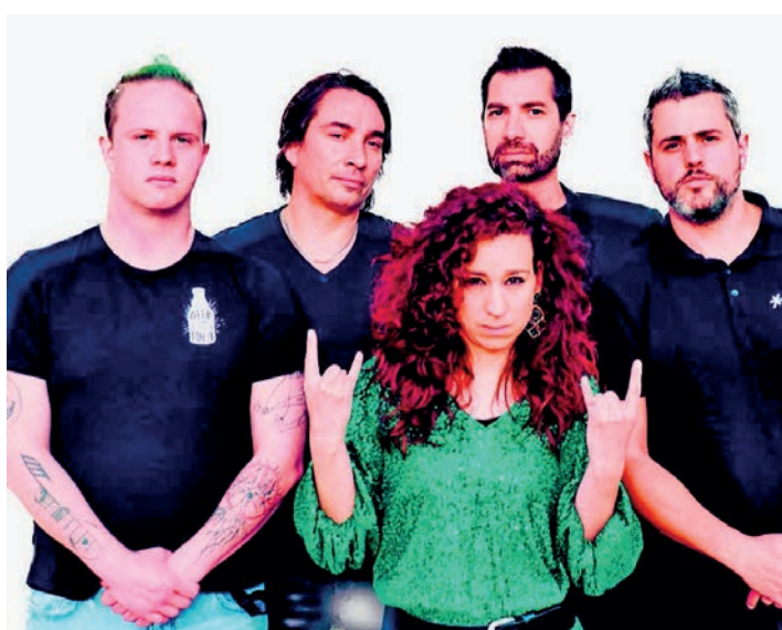
Crystal Or, des musiciens expérimentés qui interprètent leurs propres compositions en français.

Samedi, la foire débutera dès 9h, avec des vendeurs qui proposeront leurs produits. Le marché aux puces ouvrira ses portes parallèlement. Dès 13h, le Moto-Club organisera un parcours de motocross pour les enfants. A 13h30, le lancer de la bouille se déroulera sur le terrain du tournoi de beach-volley. Le Centre animation jeunesse (CAJ) de Péry-La Heutte et environs sera sur place, dès 14h30, avec notam-