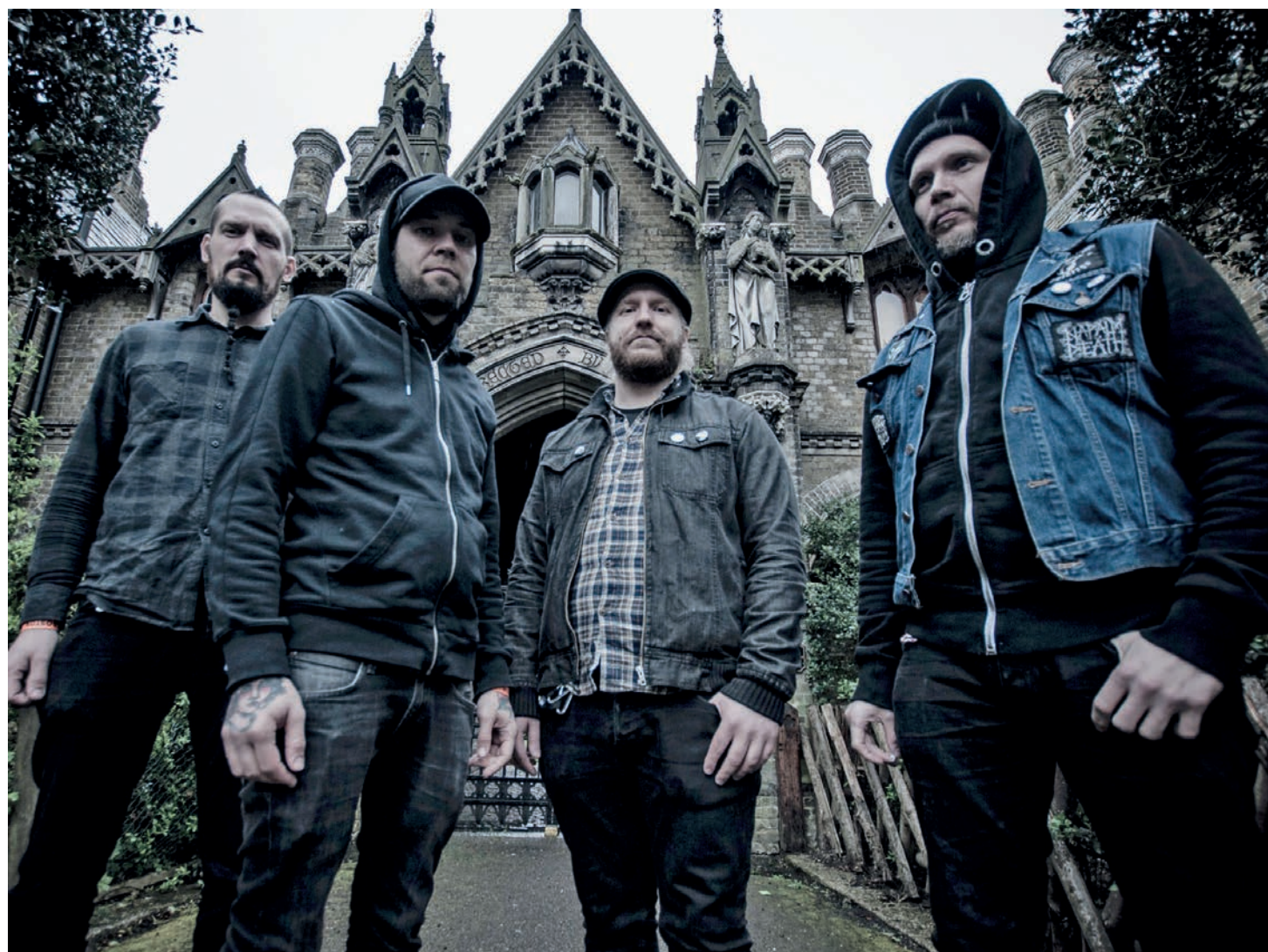
Vendredi soir, les Finlandais de Rotten Sound seront la grande tête d'affiche.

A cela s'ajoute, qu'au fil des ans, le festival s'est peu à peu taillé un nom en France voisine, et en particulier à Lyon et à Besançon, où une scène Métal pro-