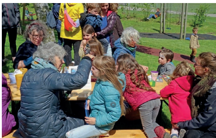
Belle affluence au stand du grimage.