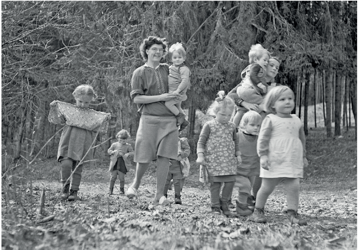
Jusqu'aux années 1970, de nombreux enfants et adolescents ont fait l'objet de placements extrafamiliaux et de mesures de coercition à des fins d'assistance en Suisse, comme ici au foyer pour enfants Sunnehus, à Frutigen, en 1947.

C'est ainsi que plusieurs localités de la région ont décidé de participer à cette action. «Le Jura bernois, au passé agricole, est concerné par ces destins brisés ou malmenés. Je trouve cela constructif que les Communes s'investissent dans cette démarche, le principal étant de faire un geste.» Aussi symbolique soit-il, ce geste devra permettre de ne pas oublier ces tristes événements afin que ceux-là ne se répètent plus.