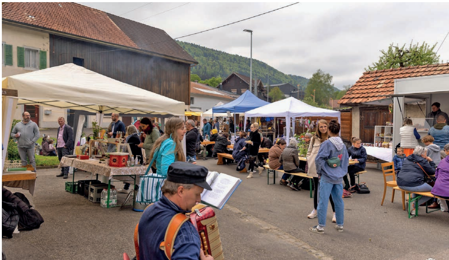
En mêlant producteurs, artisans, artistes et même thérapeutes, les initiatrices ont amené une rencontre inédite au niveau local.