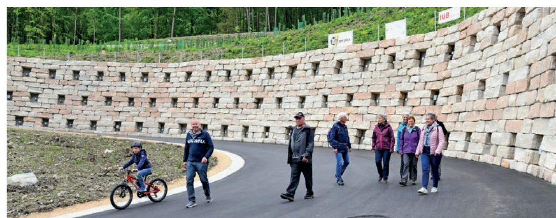
Selon Manfred Bühler, même la voie lente pourrait poser quelques problèmes.

«Contact a-t-il été pris avec l'entreprise Vigier pour ce faire,