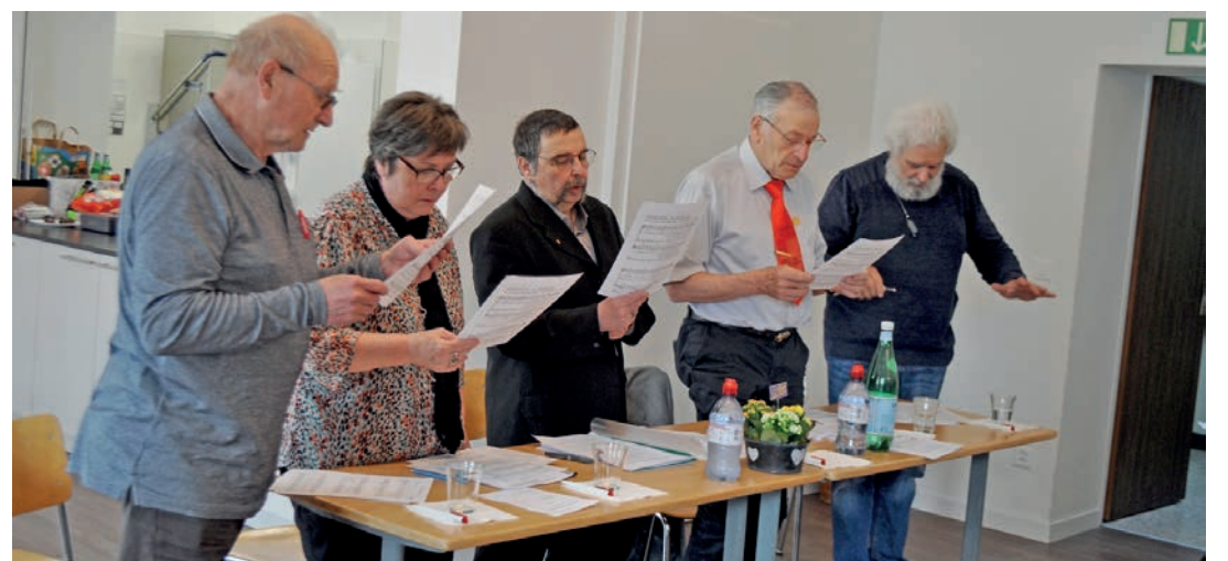
Plusieurs membres du comité et délégués ont chanté en ouverture de leur AG.