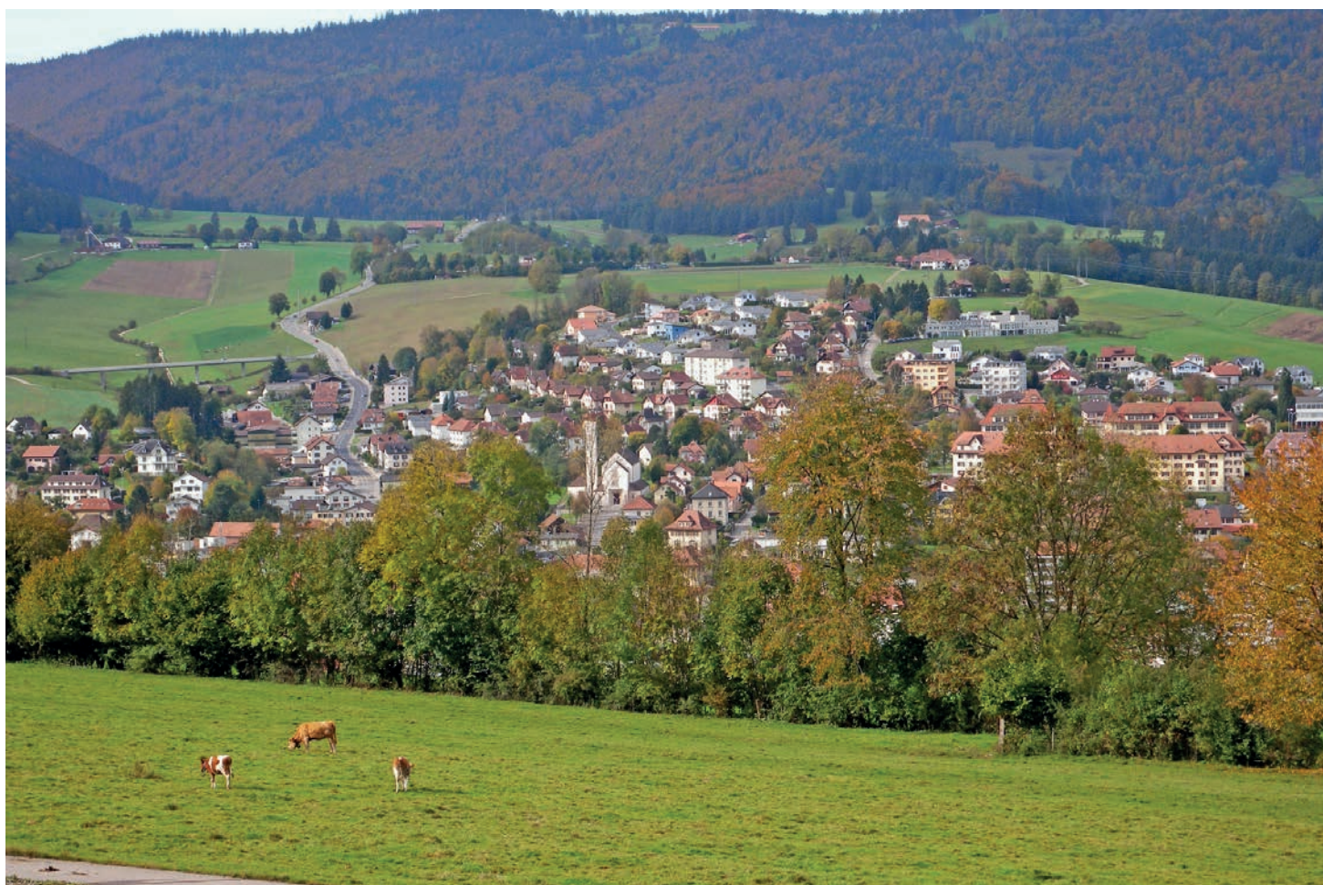
Les membres des Exécutifs des villages de la région ont besoin d'un bagage de plus en plus complet.

Comprenez par là que les orateurs de Courtelary tiennent à sensibiliser les élus quant au