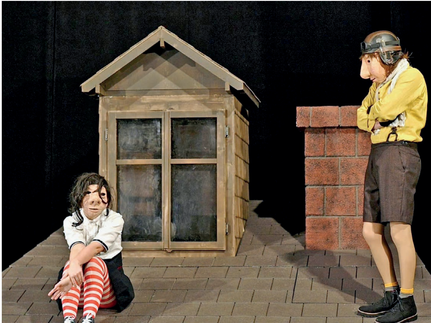
Le ciel au-dessus, la nouvelle création d'Utopik Family proposée au CCL de Saint-Imier en début d'année, a rencontré un beau succès.

«Nous avons convenu de mener deux ou trois actions par année en accord avec le calendrier de la commune et celui de la paroisse, et nous nous réjouissons de participer à la Quinzaine culturelle qui débute le