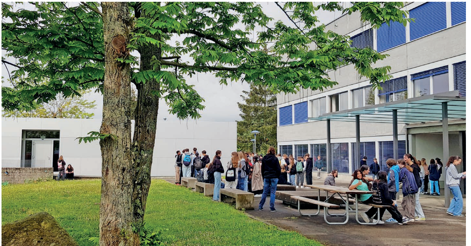
Le 50e anniversaire du Collège du District se tiendra le samedi 1er juillet, de 11h à 16h.