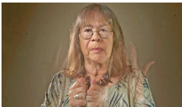
La thématique «Avec», autour de la notion de culture inclusive, occupera le mois de juin du CCL.

Conçue par Pro Infirmis, cette exposition poignante, dépeint le quotidien des personnes vivant avec une déficience auditive. Elle présente une collection de panneaux réunissant des textes, des témoignages, ainsi que des photographies