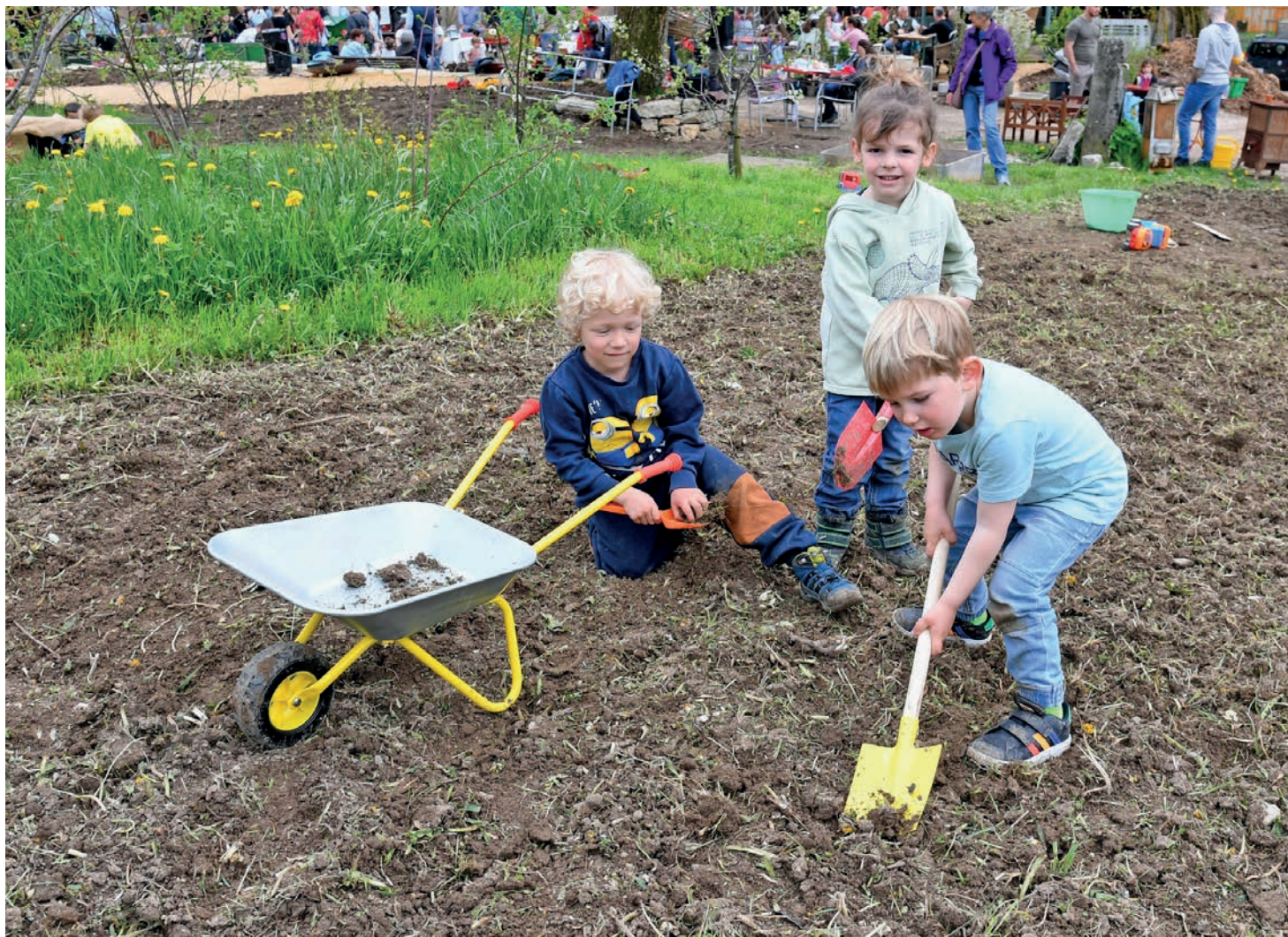
Les enfants pourront cultiver leur lien à la nature dans une crèche au concept unique dans la région.

Dans un cadre mi-rustique, mi-moderne, cerné de pâturage boisés et d'arbres fruitiers, parents, grands-parents et curieux ont découvert une surface d'environ 115 mètres carrés, apte à accueillir chaque jour jusqu'à 15 enfants, âgés de trois mois à cinq ans. Ces derniers pourront accé-