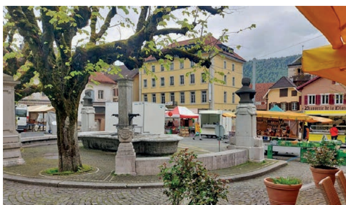
La place du Marché mérite un petit coup de cravache pour le rendre plus vivant, selon les élus ARC.